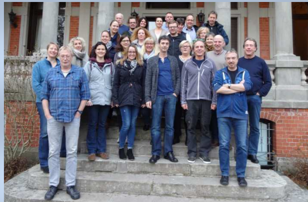
„Wir können Schule!“

Die außerunterrichtlichen Angebote finden jeweils am Nachmittag statt. Für die fünften und sechsten Klassen werden sie am Mittwoch und Donnerstag verpflichtend sein.